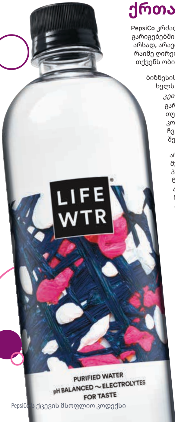
PepsiCo აქვეყნებს მსოფლიო კოდექსს

გადახდა ფორმალობის გამარტივებისთვის არის მთავრობის მაღალჩინოსნის მიმართ განხორციელებული გადახდა, არადისკრეციული მოქმედებების ან მომსახურებების დასაჩქარებლად, როგორცაა, პოლიციის დაცვის ან საფოსტო მომსახურების უზრუნველყოფა, ვიზის დამუშავება, სანებართვო ან სალიცენზიო განაცხადები, ან კომუნალური მომსახურების უზრუნველყოფა, როგორცაა სატელეფონო მომსახურება, წყალი და ელექტროენერგია. ეს გადასახადები აკრძალულია PepsiCo-ში, თუნდაც დაშვებული იყოს ადგილობრივი კანონით.