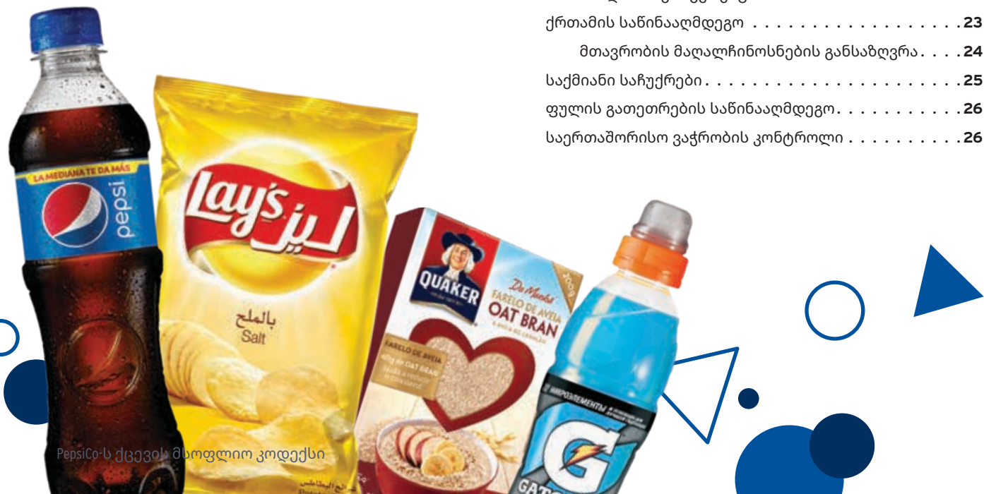
PepsiCo-ს ქცევის მსოფლიო კოდექსი

PepsiCo-ს იურიდიული დეპარტამენტი. . . . . 42